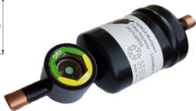
HANSA Artikeliste Multiplex - Kombis Lötanschluss