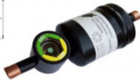
HANSA Artikeliste Multiplex - Kombis Lötanschluss